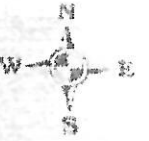
СХЕМА РАЗМЕЩЕНИЯ ПРОЕКТИРУЕМОГО ОБЪЕКТА (ПРИСТРОЙКИ)